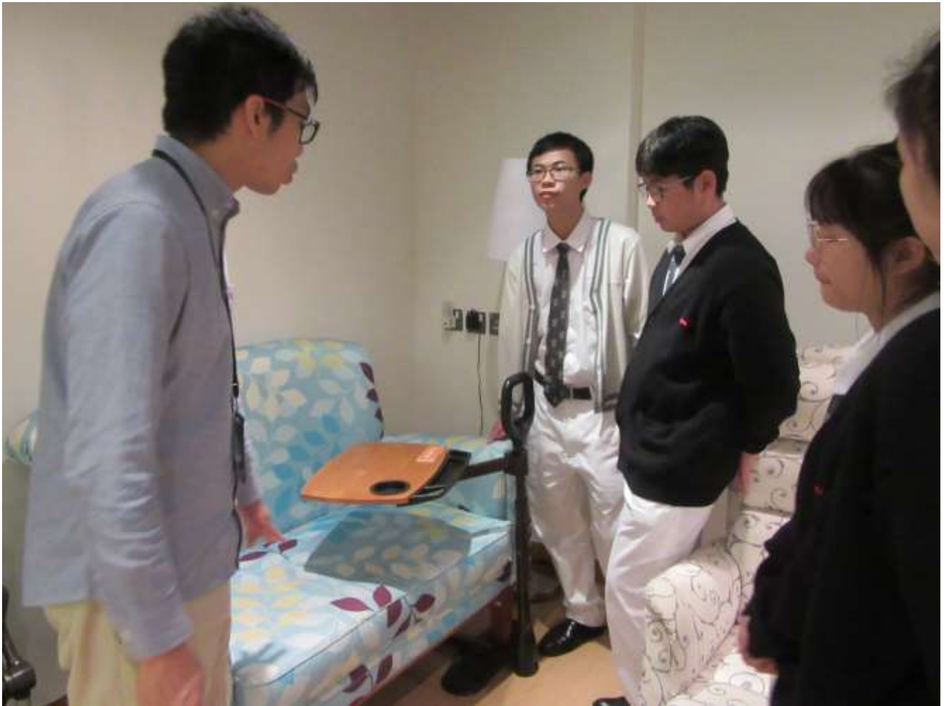
◇ 新生精神康復會石排灣綜合培訓中心